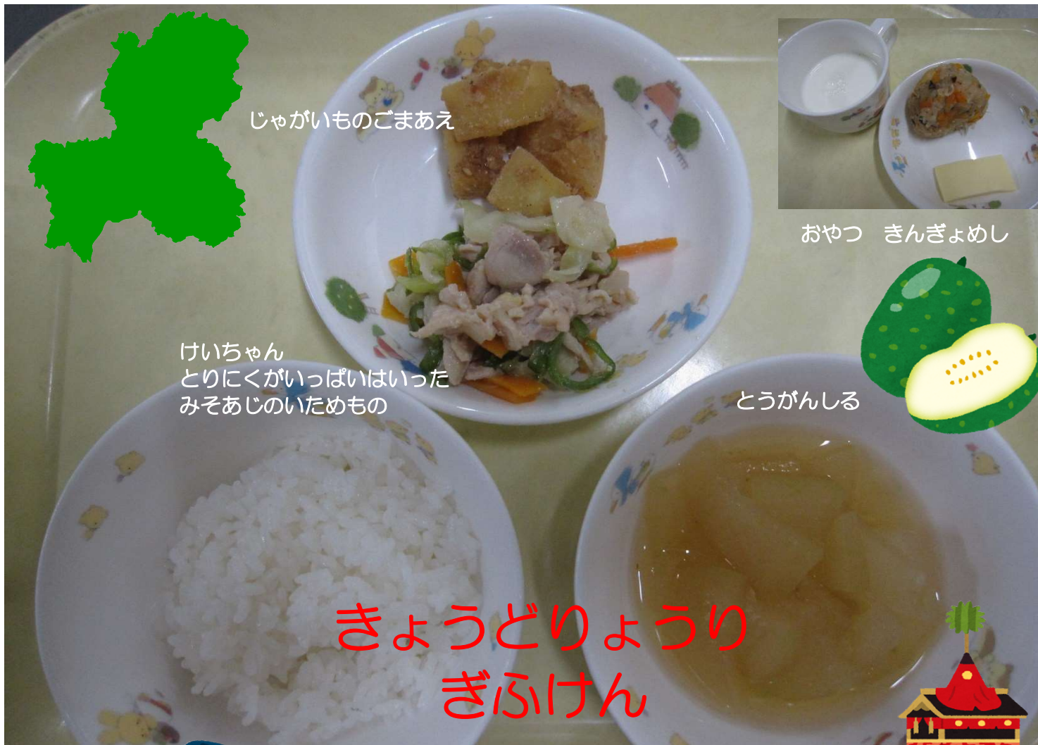
じゃがいものごまあえ