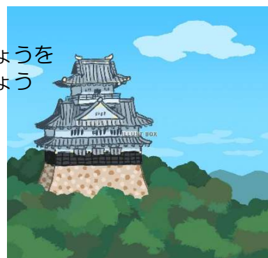
ぎふじょうときんかざん やまのうえにおしろがあるよ