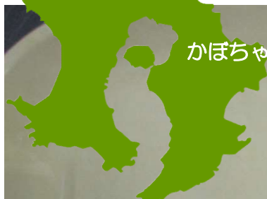
かぼちゃのそぼろに