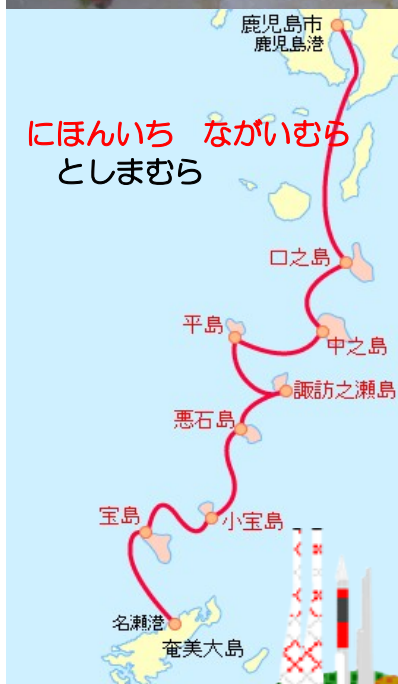
にほんいち ながいむら としまむら