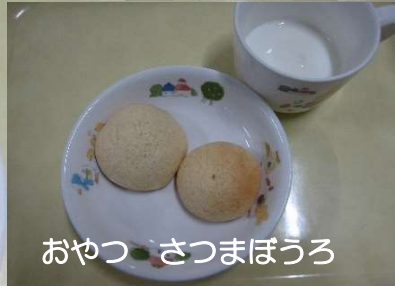
おやつ さつまぼうろ