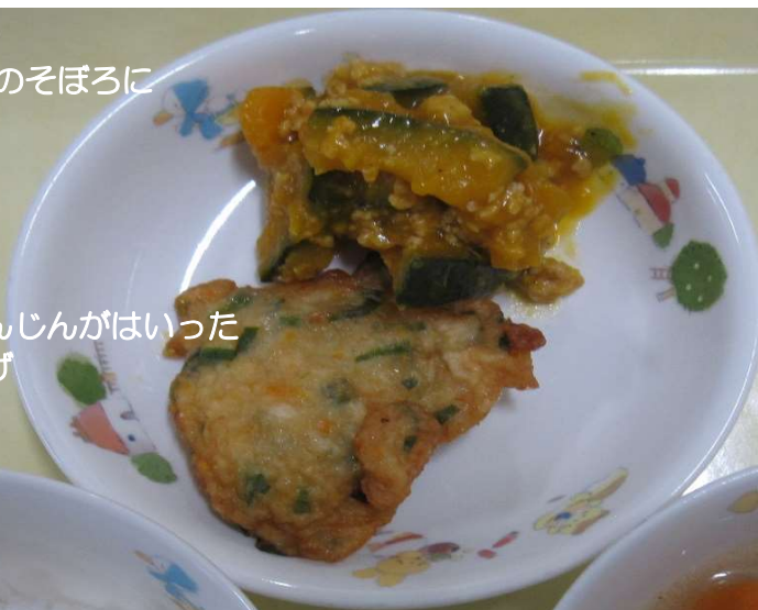
にらとにんじんがはいった さつまあげ